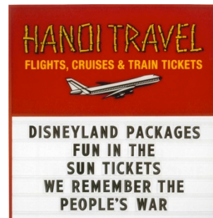
Hanoi Travel, 2000

「Hanoi Travel」は、旅行会社の看板ですが、「WE REMEMBER THE PEOPLE'S WAR」というメッセージの挿入により、たちまち不調和音を奏で出すと同時に、看板というメディアを用いることによって、公共文化におけるプライベートな領域についても疑問を投げかけています。