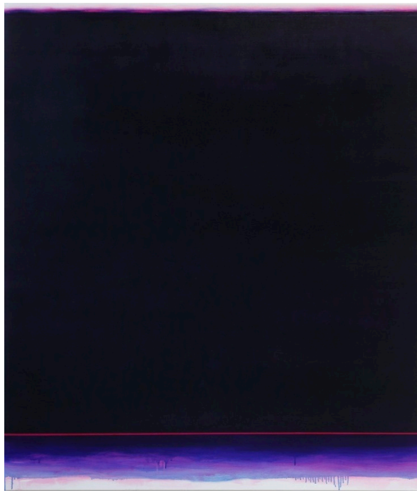
Veil (red) 2014 Oil on linen

代表作である深い精神性を感じるモノクローム絵画のシリーズは、モノクロームでありながら何層にも絵具を重ねることによって得られる、吸い込まれるような透明感のある漆黒の闇をたたえており、アーティストが幾度も試行を重ねた痕跡を残しています。また、光の帯を思わせる絵画 Bound for Eternity においては、モノクロームの色彩から解放感に満ちた光が帯となってあふれ出し、その光はゆっくりと静かに観るものの心に満ちて行くような感覚を与えます。