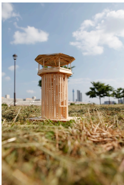
TOKYO IN PROGRESS Shioiri Tower Plan1 2010年

「プロジェクトドキュメント 東京インプログレス 2010-2013」ではプロジェクトに関連したモデル、レリーフ、ドローイング、プラン、また、ギャラリー空間にあわせて制作された新作などを展示いたします。また、7月下旬には、4年間のプロジェクト記録を収めた「東京インプログレス・ドキュメントブック」（美術出版社）が発行されます。MISA SHIN GALLERYでは初の個展となる、川俣正の「プロジェクトドキュメント 東京インプログレス 2010-2013」をどうぞご覧下さい。