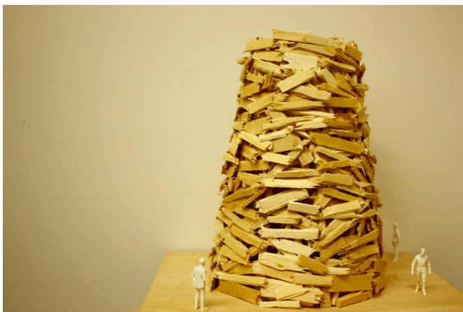
TOKYO IN PROGRESS Plan for Tsukuda No.1 2011年