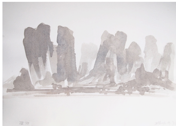
Guilin, 1997, watercolor on paper, 24x32.7cm

磯崎新の建築の活動とドローイングの関係を探る「一本の線」にどうぞご期待ください。