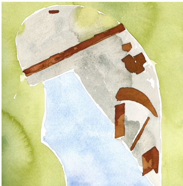
Nanjing, 2008, watercolor on paper, 25x23.5cm

— すべては「一」から始まり、絵も書も「一」に集約される。つきつめるところ一本の線であり、そこにすべてが表される。（石濤「画語録」より）