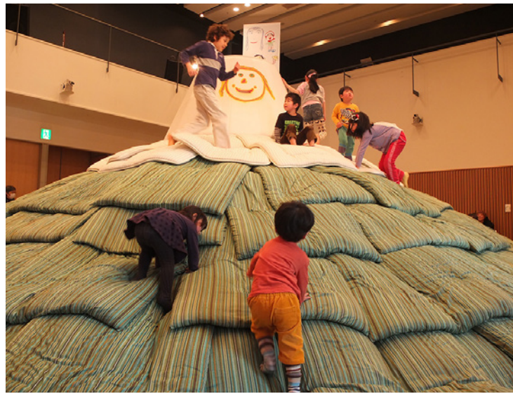
展示風景：小沢 剛 あなたが誰かを好きなように、誰もが誰かを好き 福島県南相馬市 2016年

「あなたが誰かを好きなように、誰もが誰かを好き」は100枚ものふとんが重ねられた巨大なふとんの山の作品です。通称「ふとん山」と呼ばれ、訪れた子どもたちはふとん山を登ったり、滑ったり、寝転んだり自由に遊びまわります。ふとんの山の頂上はポストになっていて、小さなカードに自分の好きな人の顔を描いて投函すると、やがてそのカードは見知らぬ誰かに届けられます。